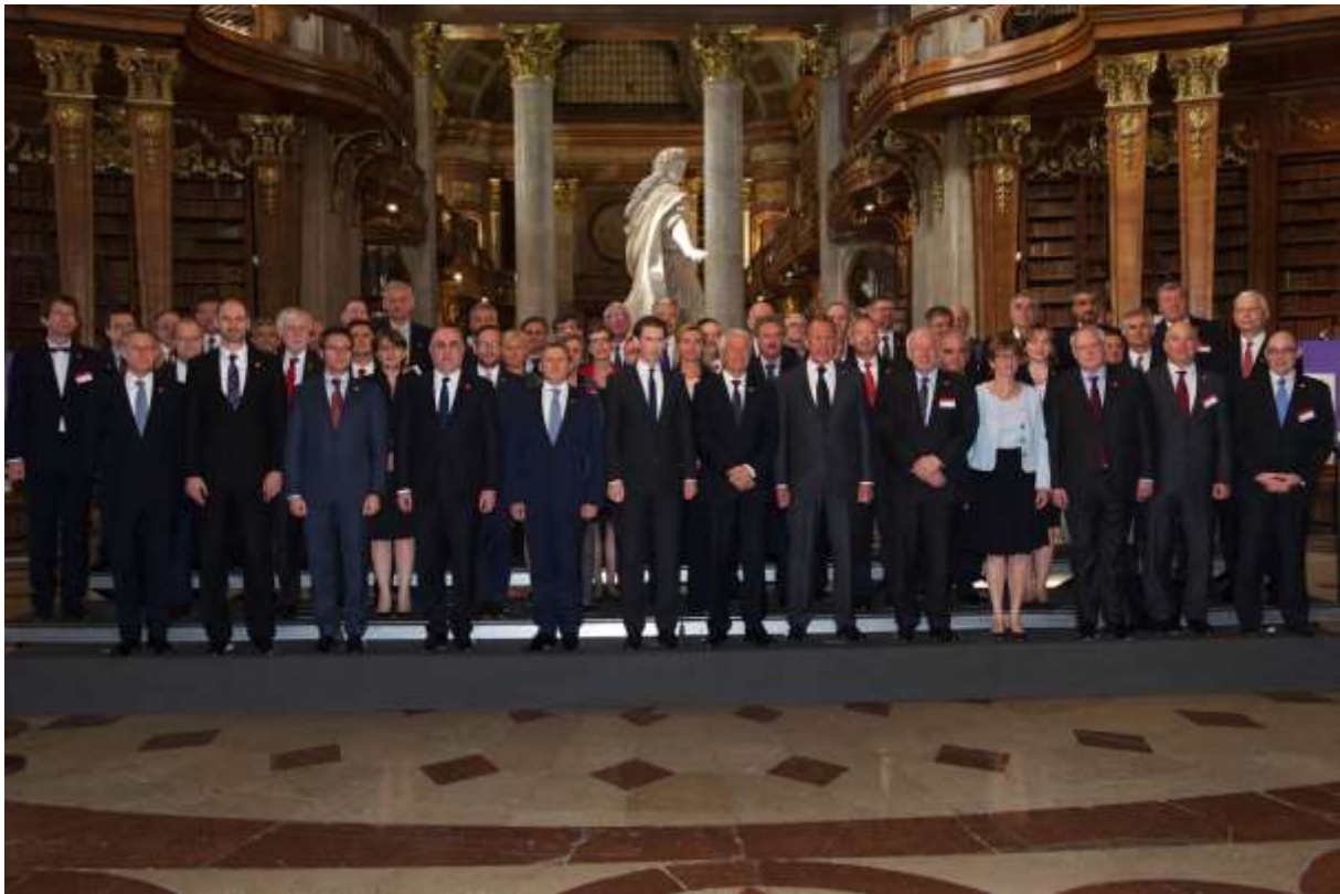
Gruppenfoto anlässlich des „Wiener Gipfels“ (Tagung des Ministerkomitees des Europarates) am 6.5.2014 im Prunksaal der Österreichischen Nationalbibliothek.

Bild Mitte nach rechts: Österreichs Außenminister KURZ, Generalsekretär des Europarates JAGLAND, Russlands Außenminister LAWROW, Präsident des Kongresses des Europarates VAN STAA (Tiroler Landtagspräsident), Präsidentin der Parlamentarischen Versammlung des Europarates BRASSEUR