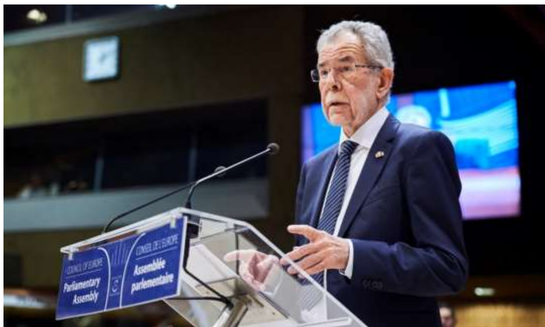
Bundespräsident Dr. Alexander VAN DER BELLEN vor der Parlamentarischen Versammlung des Europarates am 25. 1. 2018 in Strasbourg