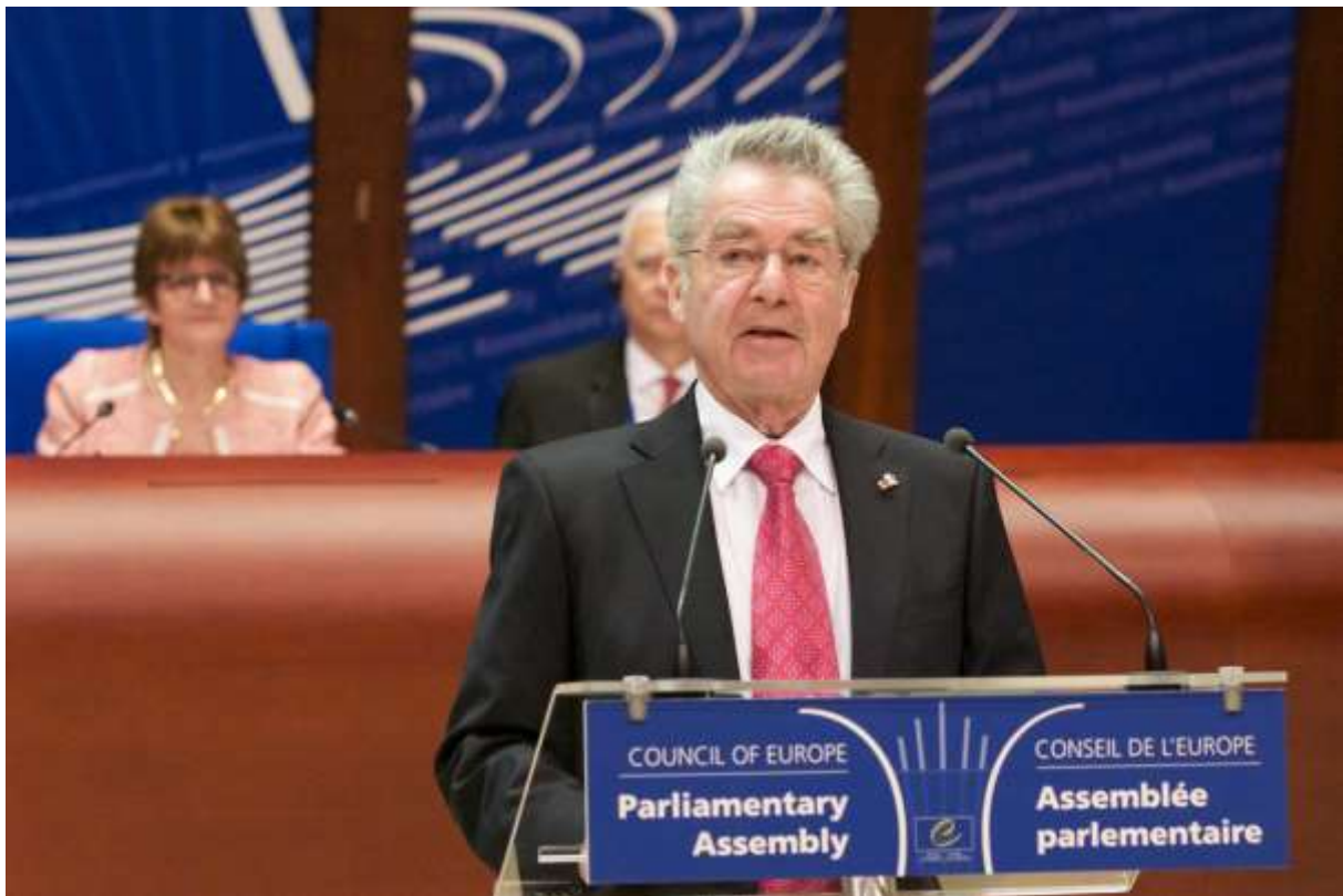
Bundespräsident Dr. Heinz FISCHER vor der „Parlamentarischen Versammlung des Europarates“ am 9.4.2014 Siehe auch Manuskript