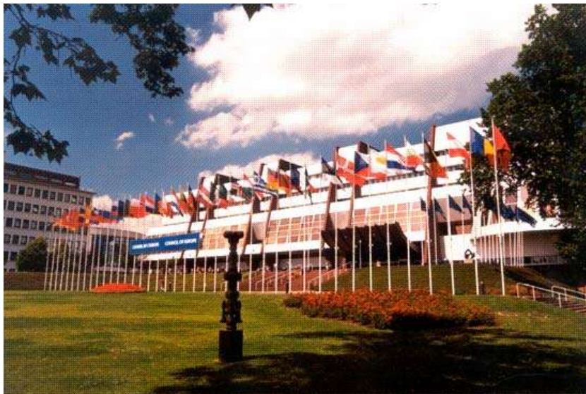
Frontansicht des „Palais de l'Europe“

Mitglieder der Parlamentarischen Versammlung des ER seit 1949