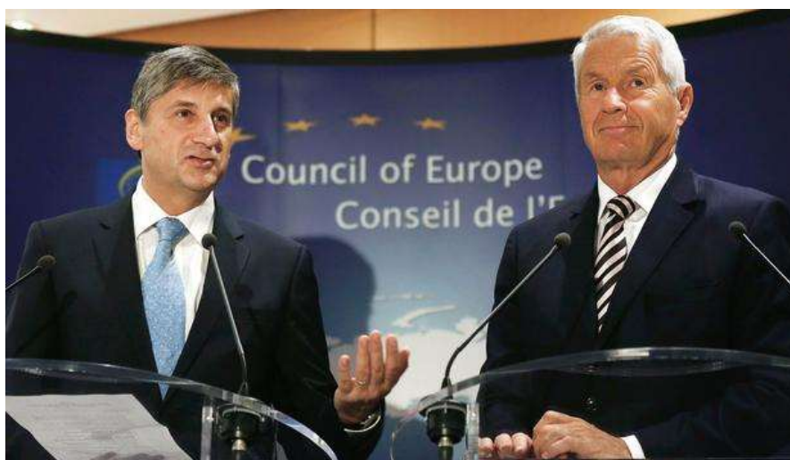
14.11.2013: Übernahme des Vorsizes im Ministerkomitee des Europarates Vizekanzler Dr. Michael Spindelegger (links) mit Generalsekretär Thorbjørn Jagland (rechts)

1959: Außenminister Dipl. Ing. Dr. Leopold FIGL 1966: Außenminister Dr. Lujo TONCIC-SORINJ 1973 / 1974: Außenminister Dr. Rudolf KIRCHSCHLÄGER 1982: Außenminister Dr. Wilibald P. PAHR 1993: Außenminister Dr. Alois MOCK 2013 / 2014: Vizekanzler Dr. Michael SPINDELEGGER und Außenminister Sebastian KURZ