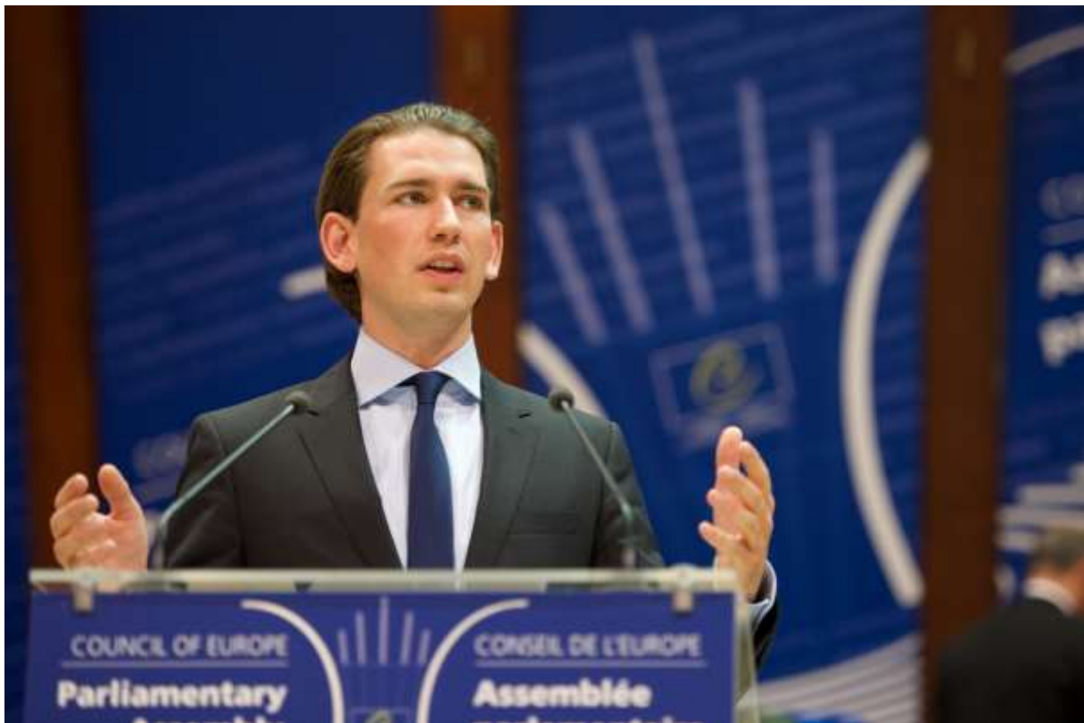
Außenminister Sebastian KURZ vor der „Parlamentarischen Versammlung des Europarates“ am 27.1.2014 Siehe auch Manuskript // LINK zur Ansprache am 7.4.2014: Manuskript