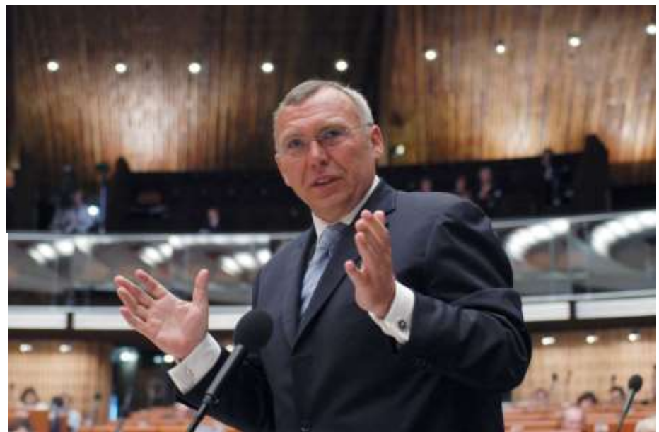
Ansprache von Österreichs Bundeskanzler Dr. Alfred GUSENBAUER am 27. 6. 2007 vor der „Parlamentarischen Versammlung des Europarates“ LINK zur Ansprache