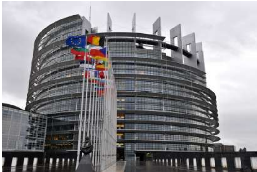
Europäisches Parlament, Strasbourg

Weitere Informationen und Videos: siehe Seite 12-13, 20-21, 25-26