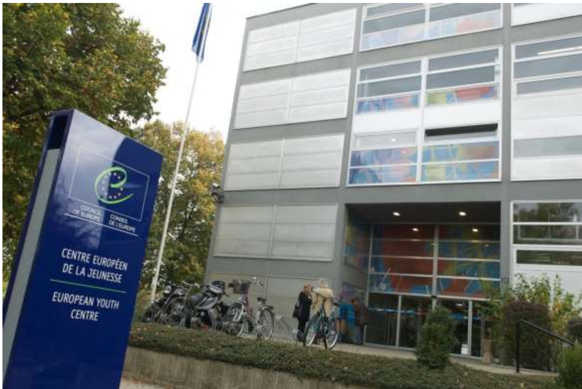
Europäisches Jugendzentrum des Europarates in Strasbourg https://www.google/Europäisches Jugendzentrum des Europarates in Strasbourg