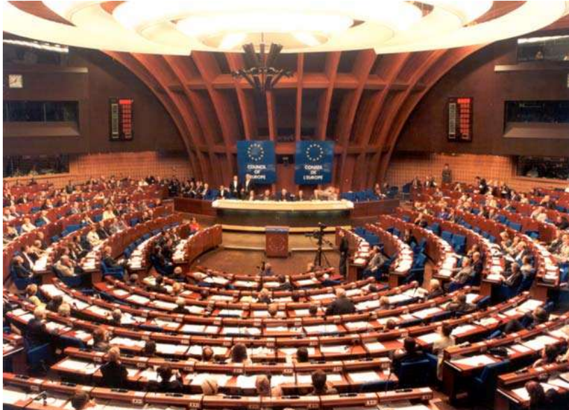
Sitzungssaal der „Parlamentarischen Versammlung des Europarates“ im „Palais de l'Europe“