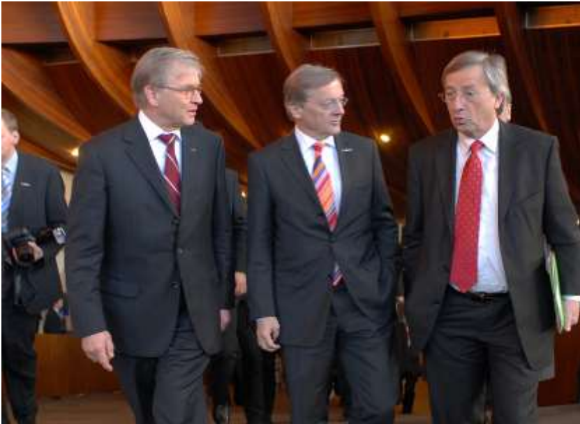
Besuch des Europarates durch EU-Ratspräsidenten und Österreichs Bundeskanzler Dr. Wolfgang SCHÜSSEL am 11. 4. 2006. Von links nach rechts: Präsident der Parlamentarischen Versammlung des Europarates Dr. VAN DER LINDEN (Niederlande), Bundeskanzler Dr. Wolfgang SCHÜSSEL, Premierminister Dr. JUNKERS (Luxembourg)