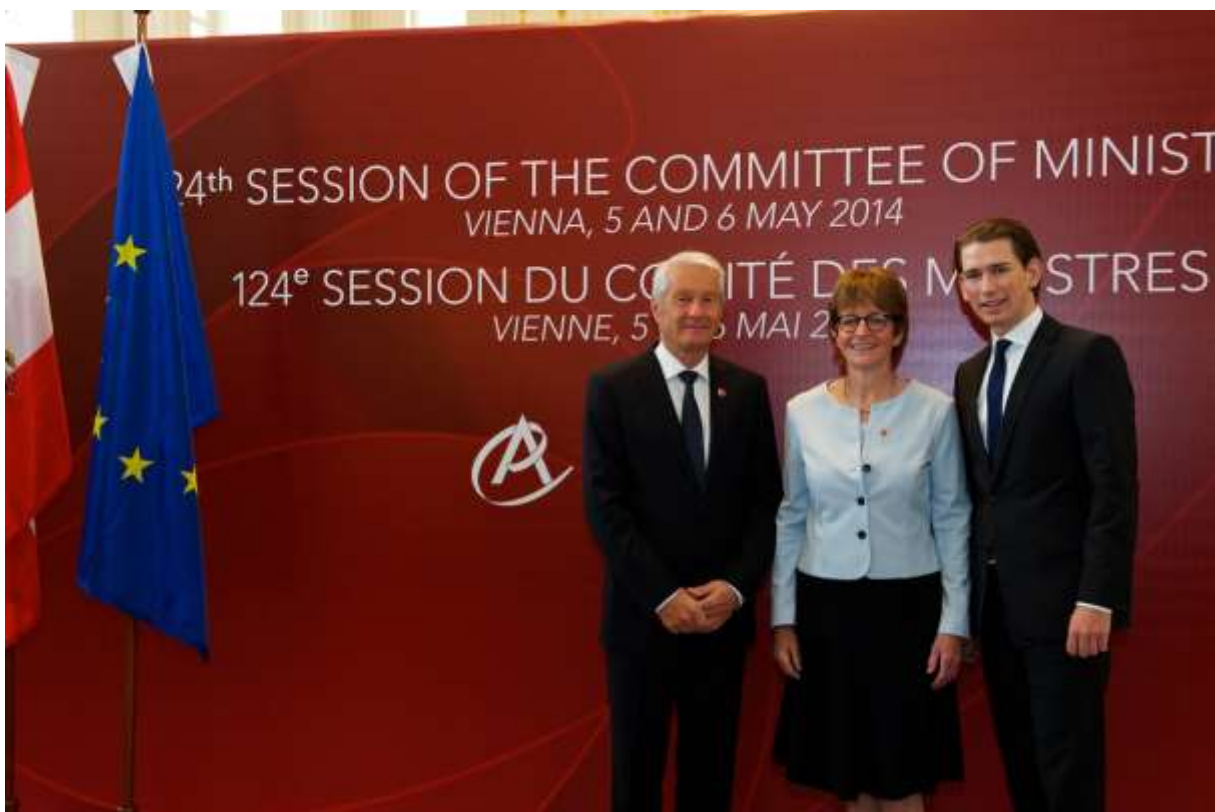
Tagung des Ministerkomitees des Europarates am 5. und 6. Mai 2014 in Wien (Wiener-Gipfel des Europarates) von links nach rechts: Thorbjørn JAGLAND, Generalsekretär des Europarates; Anne BRASSEUR, Präsidentin der Parlamentarischen Versammlung des Europarates; Sebastian KURZ, Österreichs Außenminister