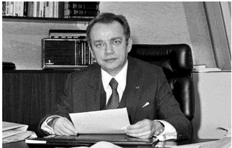
Dr. Franz KARASEK , ehemaliger österreichi- scher Nationalratsab- geordneter und General- sekretärs des Europarates von 1979 bis 1984