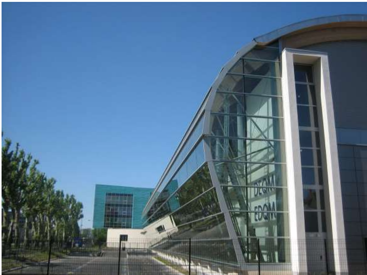
Europarat – Europäisches Direktorat für die Qualität von Arzneimitteln (EDQM), https://de.wikipedia.org/wiki/Europäisches Direktorat für die Qualität von Arzneimitteln https://www.edqm.eu/en