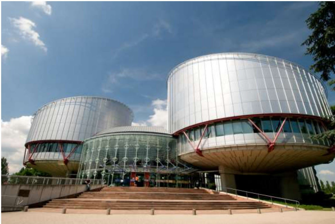
Palais der Menschenrechte: Sitz des Europäischen Gerichtshofes für Menschenrechte https://www.google/Palais der Menschenrechte - Europischer Gerichtshof fur Menschenrechte