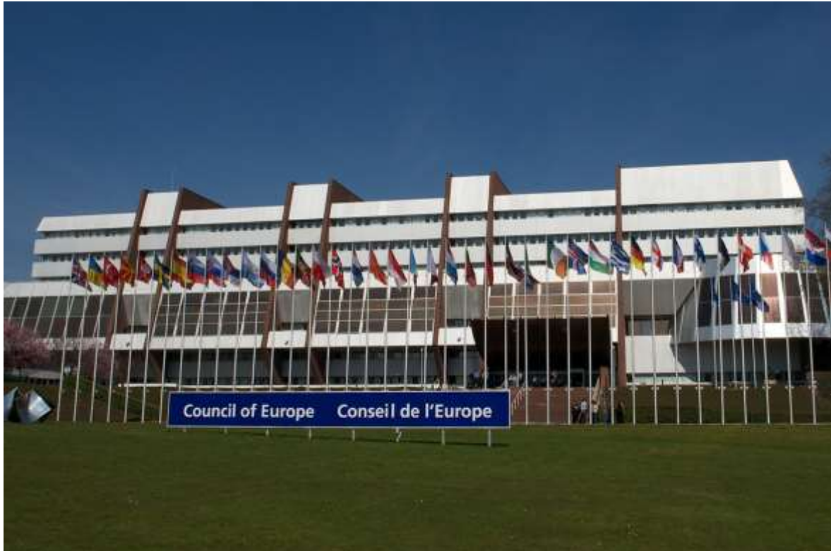
Palais de l'Europe: Sitz des Europarates in Strasbourg https://www.google/Europarat-Palais-de-l'Europe