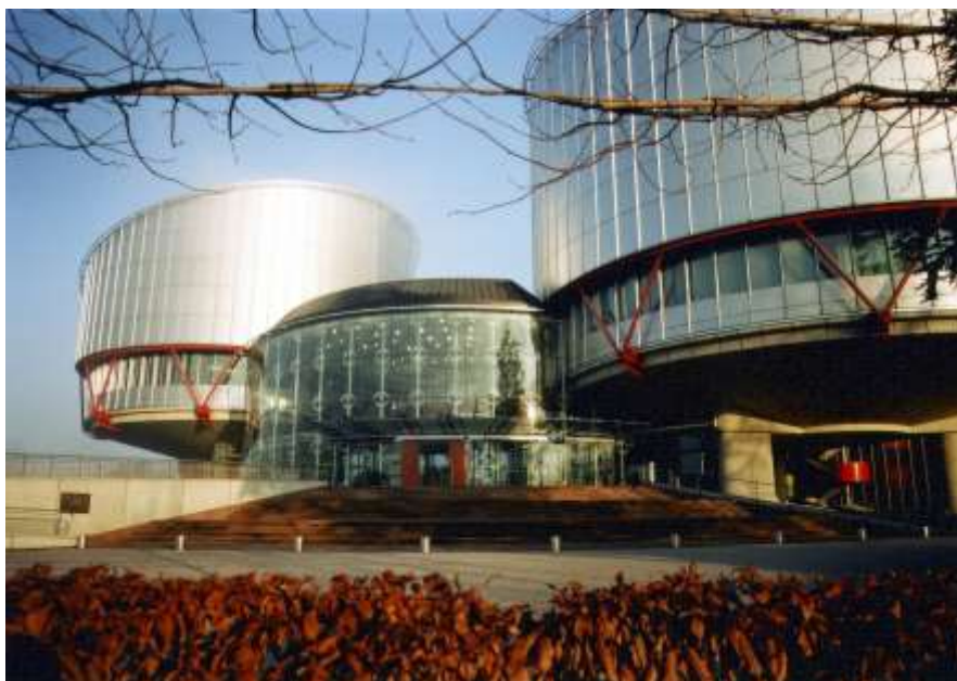
Europäischer Gerichtshof für Menschenrechte, Strasbourg

http://www.youtube.com/watch?v=gC_k0cliW7c