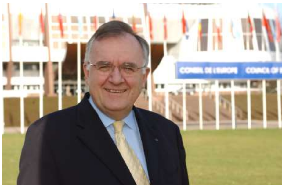
Dr. Walter SCHWIMMER , ehemaliger österreichi- scher Nationalratsab- geordneter und General- sekretärs des Europarates von 1999 bis 2004