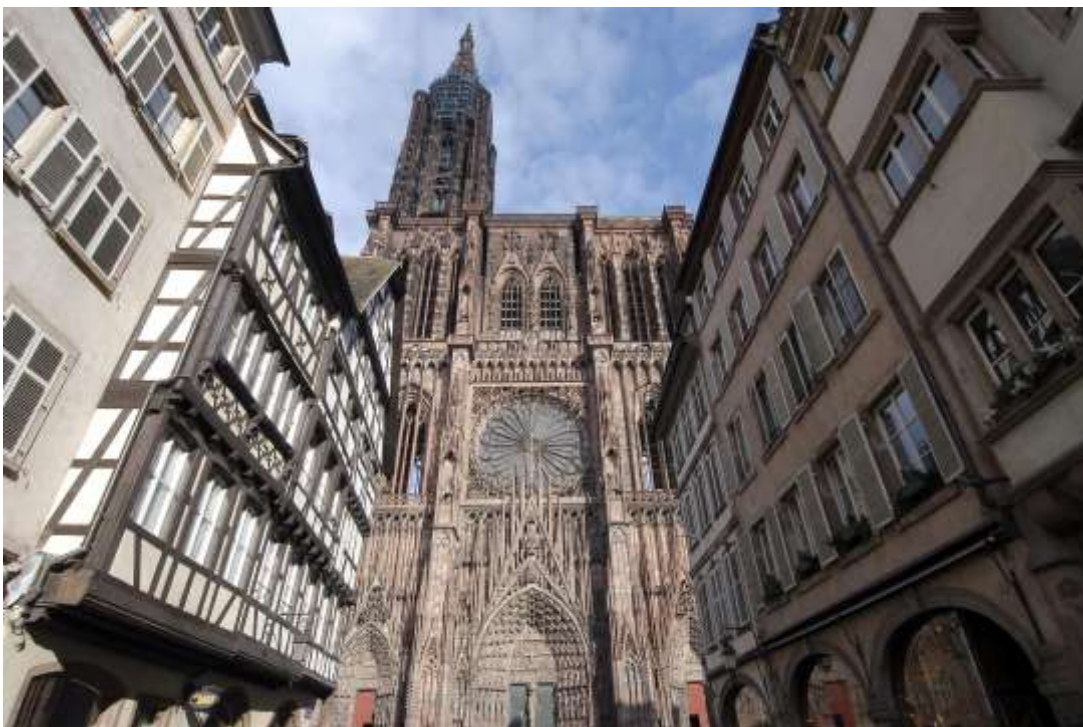
Kathedrale in Strasbourg