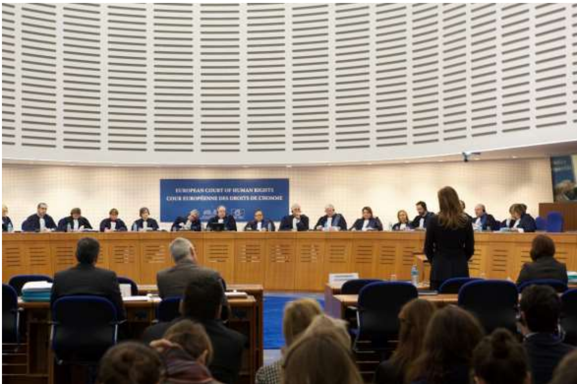
Verhandlungssaal des Europischen Gerichtshofes fur Menschenrechte in Strasbourg https://www.google/Verhandlungssaal des Europischen Gerichtshofes fur Menschenrechte https://www.google/Europische Menschenrechtskonvention