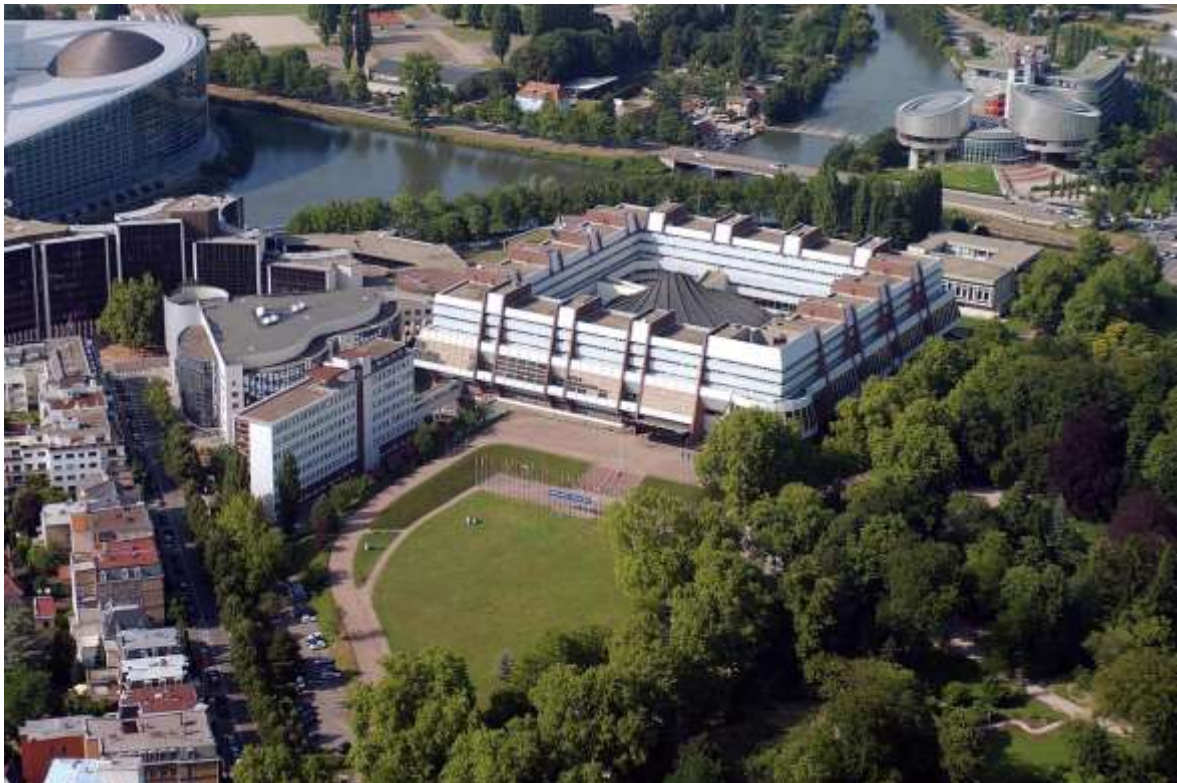
Palais de l'Europe in Strasbourg: Im Hintergrund befindet sich links das Europäische Parlament und rechts im Hintergrund befindet sich der Europäische Gerichtshof für Menschenrechte https://www.google/Europarat-Palais-de-l'Europe