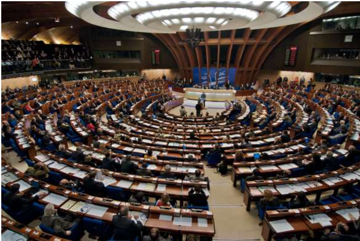
Plenum der Parlamentarischen Versammlung des Europarates im Palais de l'Europe in Strasbourg https://www.google/Parlamentarische Versammlung des Europarates