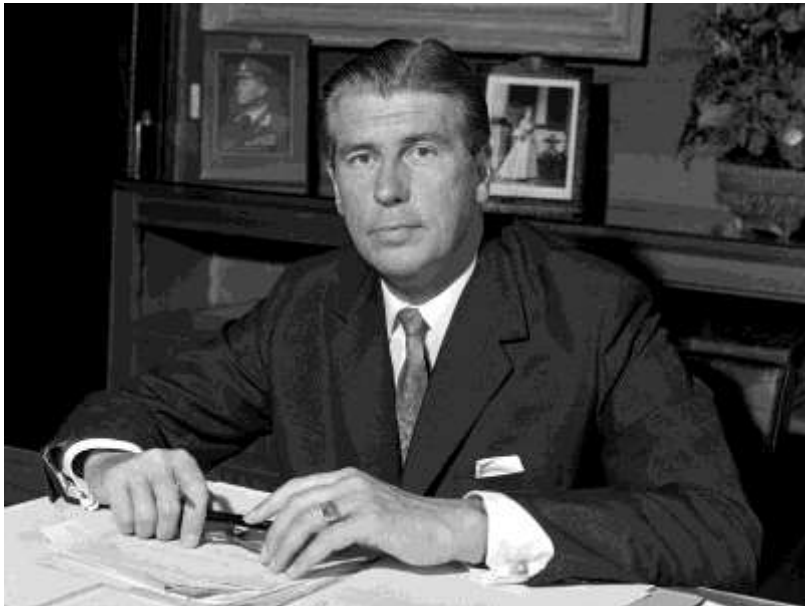
Dr. Lujo TONCIC-SORINJ , ehemaliger österreichischer Außen- minister und Generalsekretär des Europarates von 1969 bis 1974