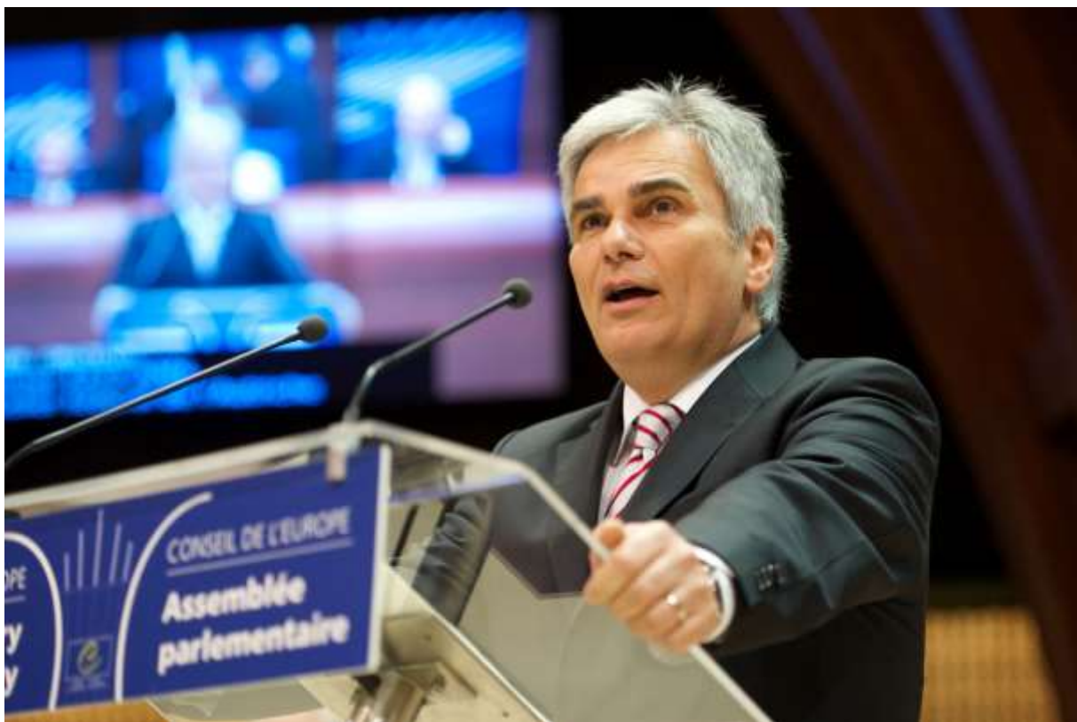
Bundeskanzler Werner FAYMANN vor der „Parlamentarischen Versammlung des Europarates“ am 30.1.2014 Siehe auch Manuskript