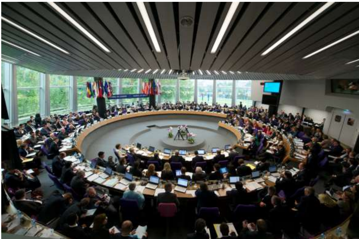
Sitzungssaal des Ministerkomitees des Europarates im Palais de l'Europe in Strasbourg https://www.google/Ministerkomitee des Europarates